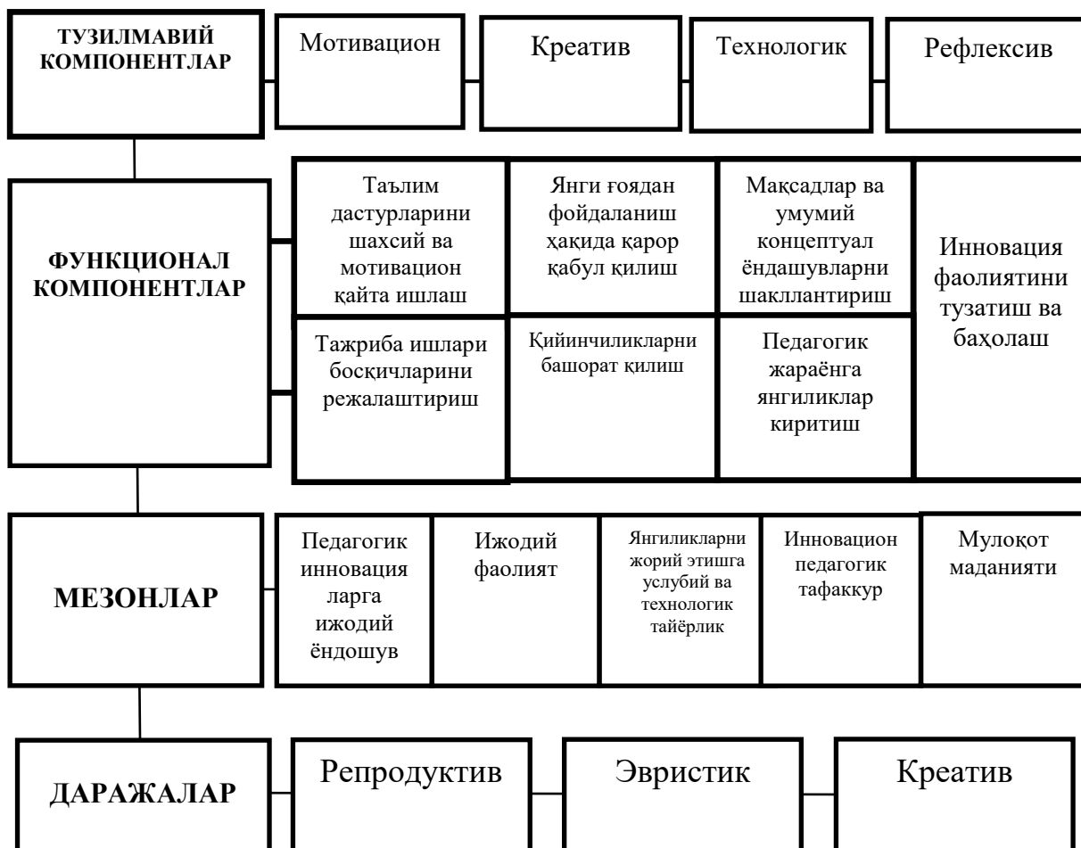
2-расм. Бўлажак ўқитувчининг инновацион фаолияти тузилмаси

Ҳозирги таълим тизими туб ислохотлар шароитида ривожланмоқда ва унда таълим олувчиларни қандай ўқитиш эмас, балки уларни қандай қилиб ўқишга ўргатиш масаласи асосий эътиборда бўлмоқда, яъни “ўқитувчи–дарслик–таълим олувчи” тузилмаси ўз функционал вазифасини “таълим олувчи–дарслик–ўқитувчи” тузилмаси билан алмаштирилмоқда. Бу эса таълим тизими олдида замонавий техника ва технологияларни ўзлаштирган, мустақил фикрлай оладиган ҳамда тегишли хулосалар чиқара оладиган ижодкор шахсни шакллантиришни талаб қилмоқда.