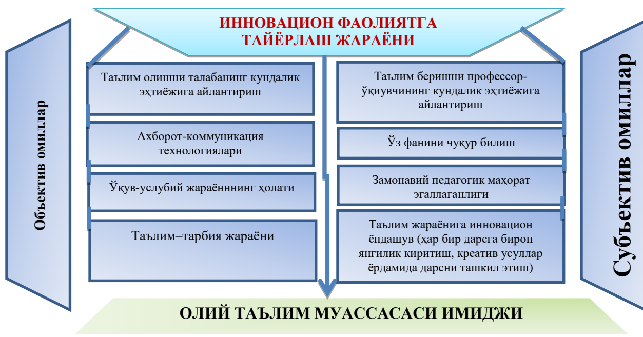
1-расм. Бўлажак ўқитувчини креатив ёндашув асосида инновацион фаолиятга тайёрлаш жараёни

Бўлажак ўқитувчини инновацион фаолиятга тайёрлашда аввало, педагогик фаолиятни илмий асосда ташкил этиш, тартибга солиш ва меҳнат шароитини ўз фаолиятига мослаштириш, касбий фаолиятга эришишда интеллектуал, креатив, мотивациявий, иродавий, шахсий, ахлоқий ва бошқа хусусиятларини ривожлантириш зарур. Бўлажак ўқитувчиларни креатив ёндашув асосида инновацион фаолиятга тайёрлаш жараёни объектив ва субъектив омилларга асосланади (1-расм)га қаранг.