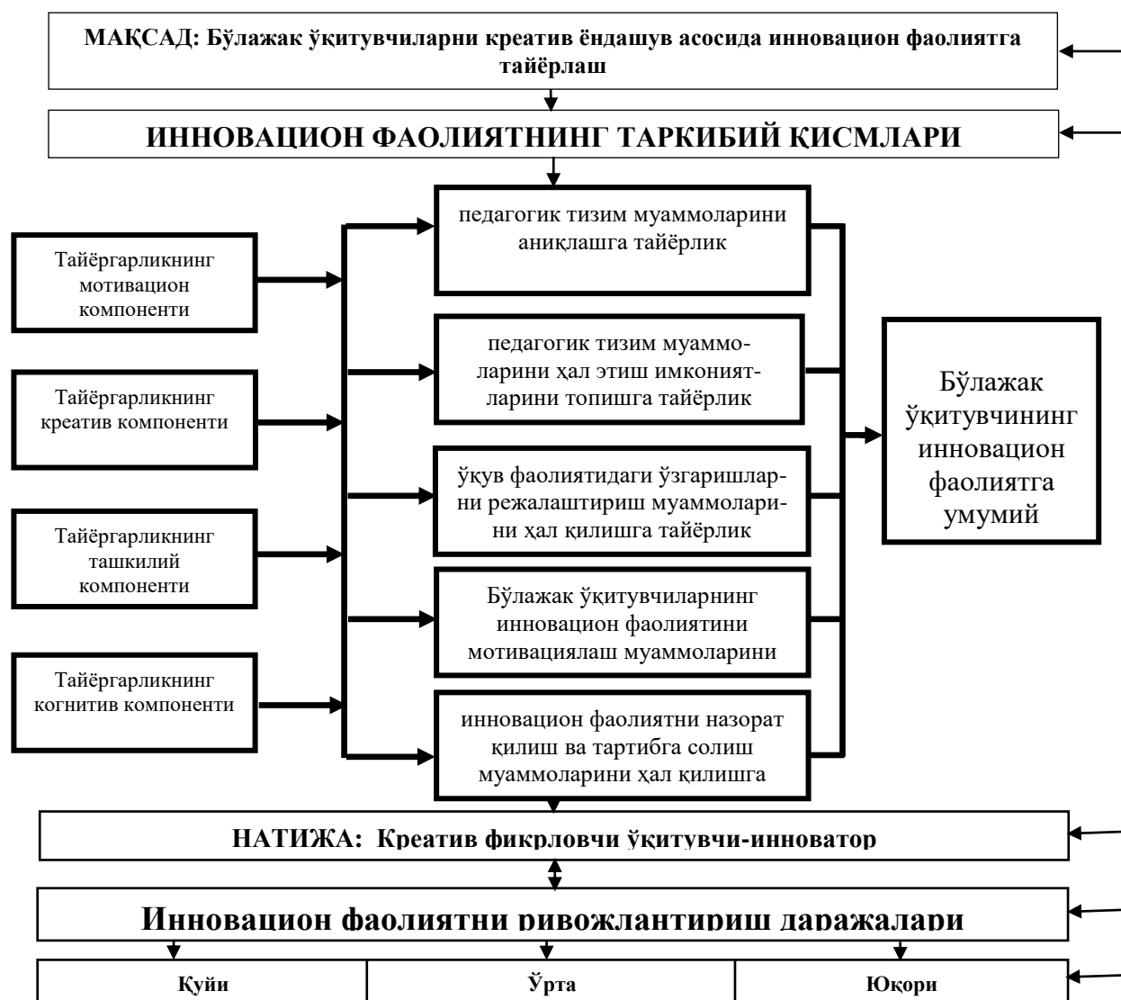
3-расм. Бўлажак ўқитувчиларни креатив ёндашув асосида инновацион фаолиятга тайёрлаш модели

ёндашув асосида инновацион фаолиятга тайёрлашнинг такомиллаштирилган модели ишлаб чиқилган (3-расм)га қаранг.