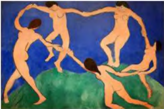
Dance (first version)

Автопортрет (грекча сўздан. Outos - ўзим) - рассом ўзини-ўзи тасвирлаган портрет. Бу ҳолда рассом ҳам, тасвирдаги шахс ҳам бир кишининг ўзидир.