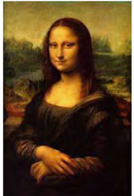
Mona Lisa (La Gioconda)

Тасвирий санъат ривожланиши тарихи асрлар оша кўп босқични босиб ўтди. Ҳорлардаги расмлардан бошлаб засмонавий услублардан фотореализмагача бўлган катта босқич давомида ҳар хил жанрлар ва услублар шунга мисол бўлаолади. Айниқса Уйғониш даврига келиб тасвирий санъатда юксакликка эришилди. Европада таниқли рассомлар ижодини кузатсак уч ўлчамли тасвирлар вужудга келди. Рассомнинг яратган асарида образлар, атроф муҳитни акс эттириш даражаси, асарни томошабин оддий идрок қилишига асло қийинчилик туғдирмайди.