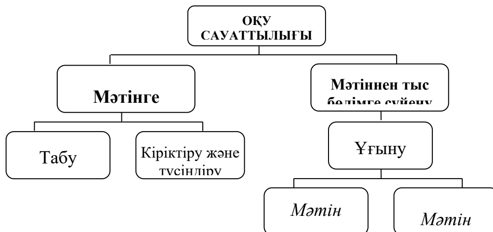
1-сурет – PISA / функционалдық оқу сауаттылығы