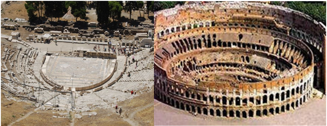
Italiyadagi Kolizey teatri V-IV asr

XIX asrning birinchi yarmida vujudga kelgan romantik yoʻnalish teatrda gumanistik ideallar va koʻp hollarda hayotiy orzularning yoritilishiga olib keldi. Dramada taqlidgoʻylikdan iborat klassitsizmga qarshi oʻziga hos milliylik, xalqchilik, tarixiylik va ijtimoiy adolat uchun kurash ohanglari keng quloq yoydi.