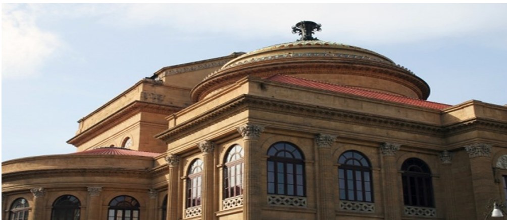
Italiya opera teatri 1875 yil qurilgan.

XIX asr oxirlaridan teatrni isloh qilishning yangi davri boshlandi. Teatr badiiy adabiyot (proza, poeziya), yangi drama (Chexov va boshqalar) bilan boyidi. XIX asr oxirlarida XX asr boshlarida teatrlarda aktyorlik sanʼatida ham yangi taʼlim uslubi – Stanislavskiy sistemasini qoʻllash boshlandi. XX asrning yigirmanchi yillarida Meyerxold, Vaxtangovlarning rejissyorlik faoliyati teatrning rivojiga katta hissa boʻlib qoʻshildi. XX asr oʻrtalarida Gʻarb rejissurasi va sahna sanʼatiga B.Brextning ijodiy uslubi katta taʼsir koʻrsatdi. Zamonaviy teatr dunyo teatrining demokratik, xalqchil anʼanalarini mustaqil oʻzlashtirib borishi, sahnaviy talqinlarning rang-barangligi bilan ajralib turadi.