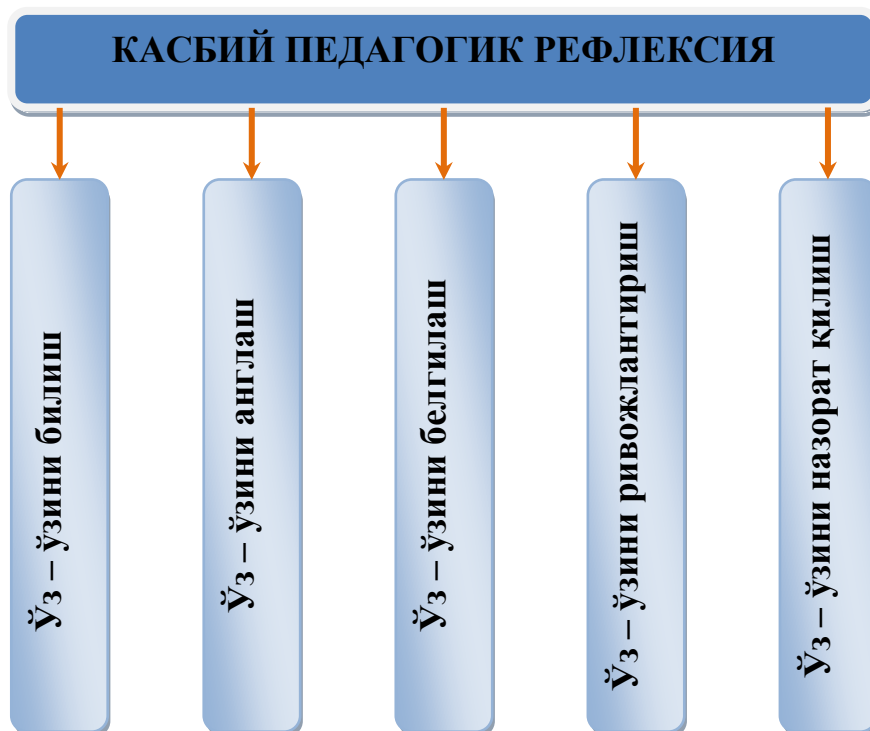
9 - чизма. Ўқитувчининг касбий рефлексияси асосида педагогик маҳоратининг ривожланиши.

Ўқитувчи педагогик фаолиятини ўрганишга бағишланган кўп йиллик тажрибалар асосида қилинган назарий хулосалар педагогик маҳоратнинг ривожланиш жараёнини бешта элементдан иборат тизим асосида ўрганиш имкониятини беради. Бу ўқитувчининг касбий рефлексияси ривожлангани сари кечадиган ва унинг асосида узлуксиз педагогик касбий маҳоратини ва ўз – ўзини такомиллаштириш имкониятини таъминлайдиган жараёнларни чуқурроқ тушунишни таъминлайди ( чизмага қаранг ).