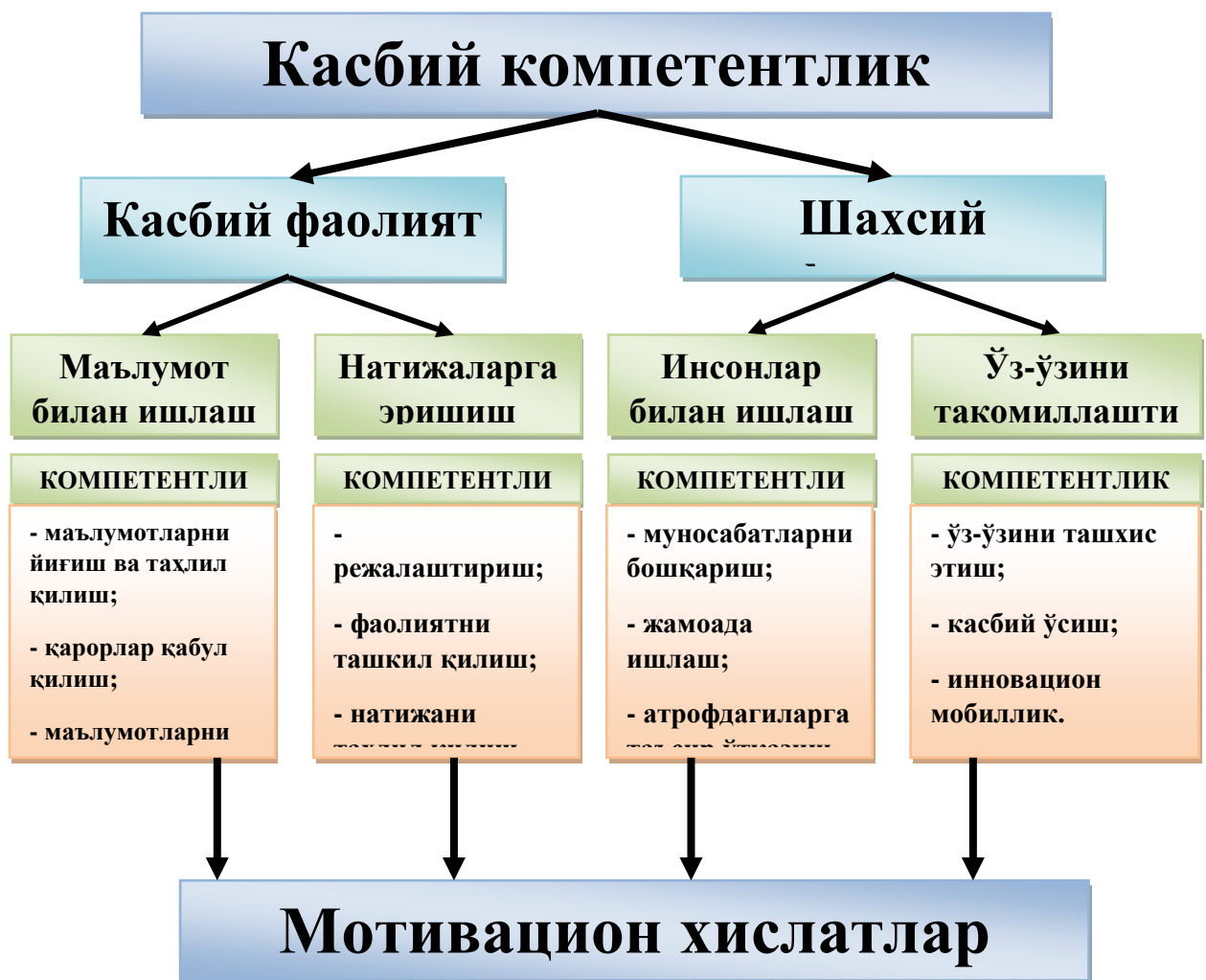
2-расм. Коммуникатив компетентликни касбий компетентлик таркибидаги ўрни

- оғзаки ва ёзма мулоқот компетенциялари, диалог, монолог, матн мазмунини англаш; анъаналар, маросимлар, этикетни билиш ва амал қилиш; расмий ёзишмалар; иш юритиш, бизнес тили; чет тилида мулоқот, коммуникатив топшириқлар, тингловчига таъсир даражалари (19) ;