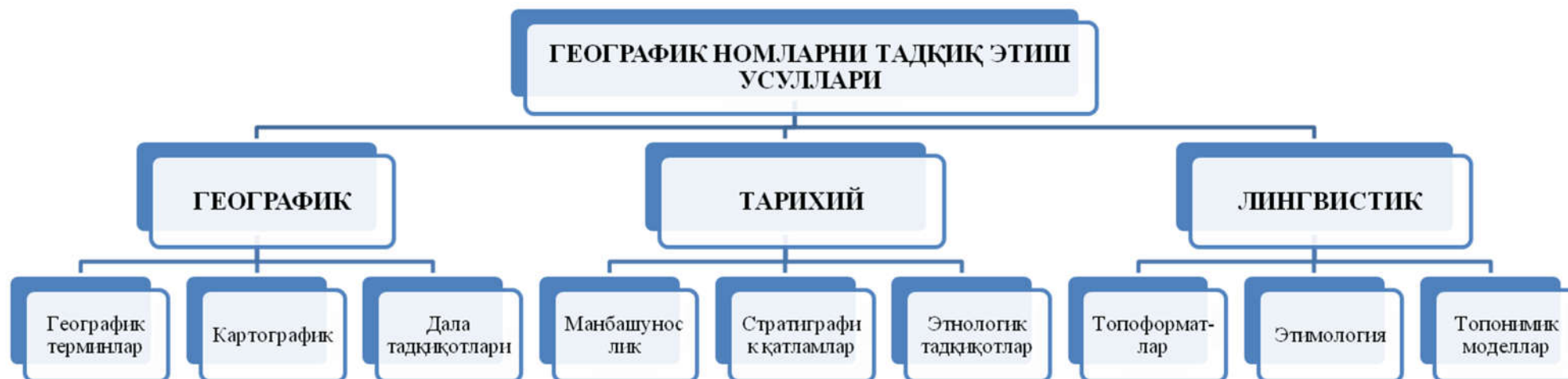
2-расм. Географик номларни тадқиқ этиш усуллари.