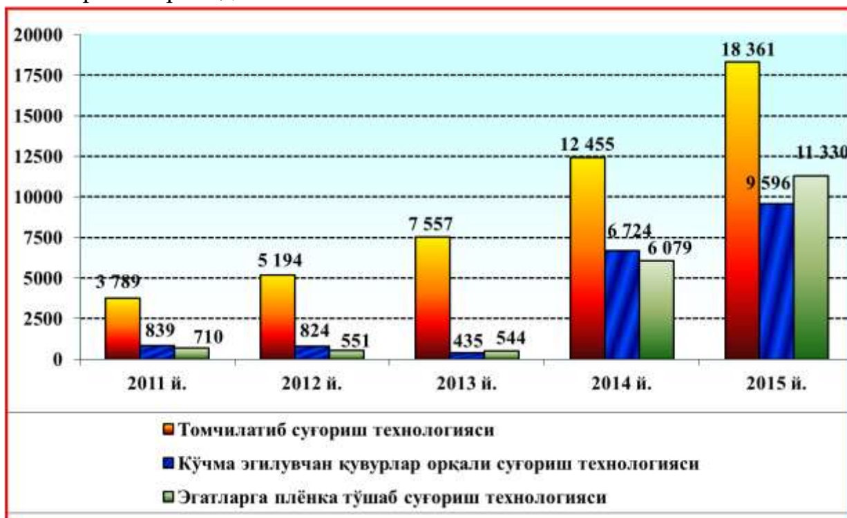
1-расм. Республикамизда 2011-2015 йилларда суғоришнинг замонавий усуллари жорий этилган экин майдонлари, га

Республикамизда 2011-2015 йилларда суғоришнинг замонавий усуллари жорий этилган экин майдонлари (гектарда) 1-расмда келтирилган. Чизмадан кўриниб турибдики, 2011 йилда 3789 га майдонга томчилатиб суғориш технологияси жорий этилган бўлса, ушбу кўрсаткич 2015 йилда 18361 гектарни ташкил этган. Ушбу даврда кўчма эгилувчан қувурлар орқали суғориш технологияси 2011 йилда 839 га, 2015 йилда эса 9596 гектар майдонга жорий этилган. Шу билан бирга, эгатларга плёнка тўшаб суғориш технологияси 2011 йилда 710 га, 2015 йилда эса 11330 гектар ер майдонида жорий этилган. Бундан кўриниб турибдики, сув ресурсларидан самарали фойдаланиш учун сув тежовчи технологияларнинг жорий этилиши йилдан-йилга ортиб бормоқда.