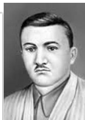
АБДУЛЛА ҚОДИРИЙ (1894-1938)

“Ўтган кунлар” романида нима учун Зайнаб қотиллика қўл урди. Асардаги муаммонинг ечими бошқача бўлиши мумкинмиди? Кейсдаги муаммони келтириб чиқарган асосий сабаблар ва хал этиш йўлларини қуйидаги жадвал асосида изоҳланг: