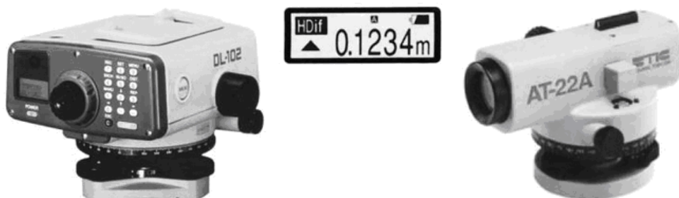
1.3–расм. Қурилишда фойдаланилувчи нивелирлар: а) TOPCON (Япония) компанияси томонидан ишлаб чиқарилувчи DL–102 рақамли нивелири; б) рақамли нивелирнинг экрани; в) TOPCON компанияси ишлаб чиқарилган компенсаторли АТ–22А нивелири.