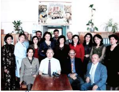
Ўзбекистон-АҚШ лойиҳасида иштирок этган термитологлар гуруҳи

-термитлар популяциялар сонини бошқаришнинг илмий асосларини ишлаб чиқиш;