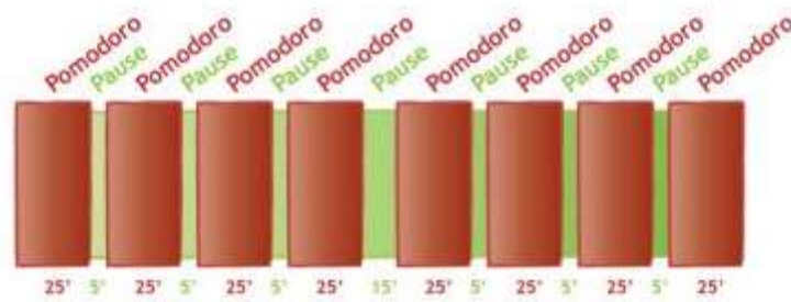
Figure 1. Découpage en pomodoro d'un TP avec ALPES