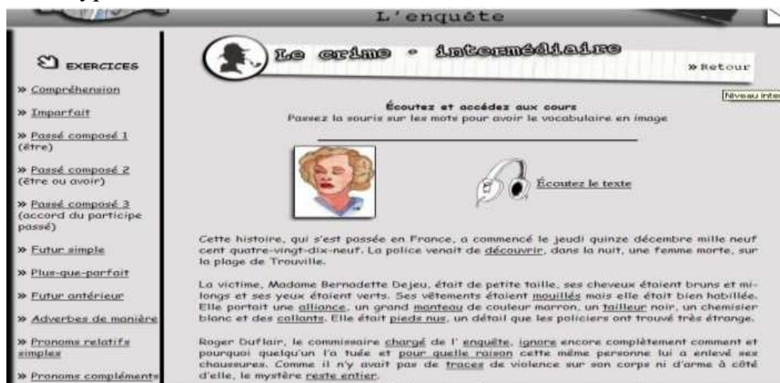
Fig. 6. Vocabulaire avec hypertexte

Pour ce qui est des histoires et des contes, un point à remarquer dans leur exploitation est l'existence d'un vocabulaire interactif avec hypertexte : il y a des mots supposés inconnus soulignés dans le texte qui renvoient à des définitions, accompagnées ou non par des images ou à des textes explicatifs parfois amusants. Voici un exemple qui présente un texte avec les mots soulignés en hypertexte :