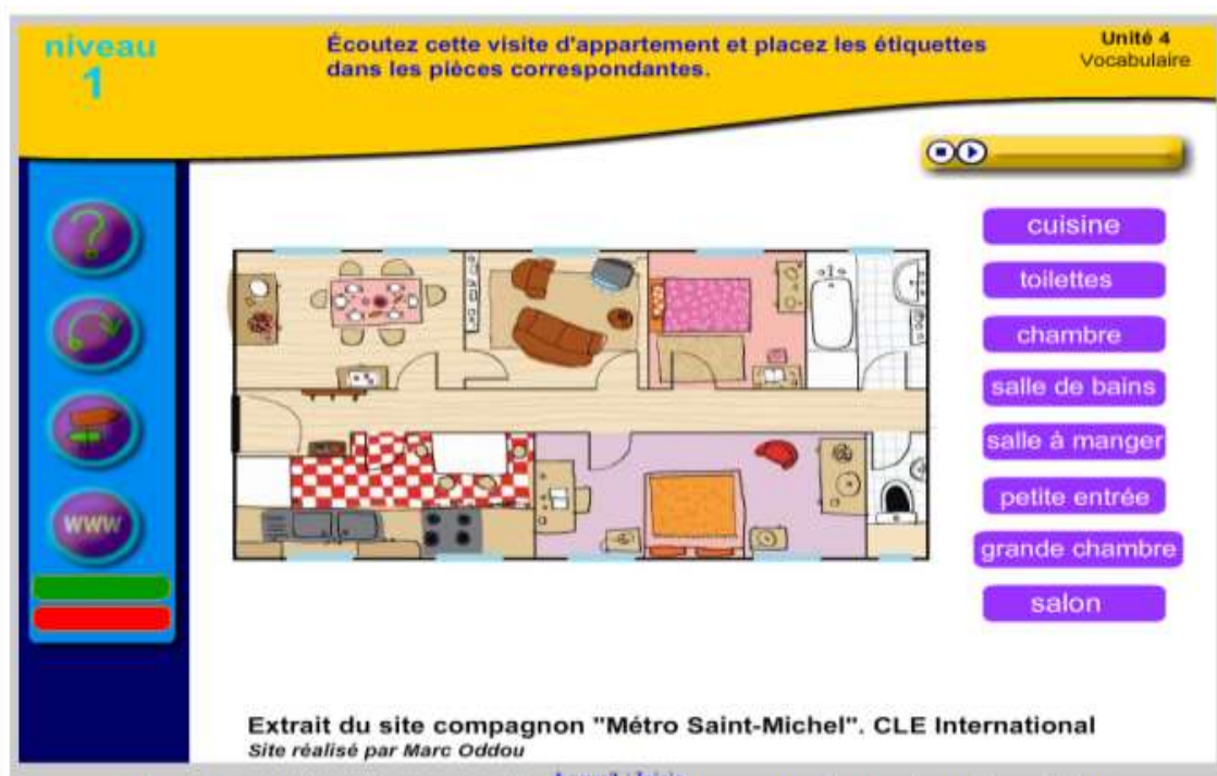
Fig. 3 Exercice de compréhension orale et manipulation des objets

Un des exercices les plus simples est celui qui demande aux élèves de glisser un texte sur l'image correspondante, comme dans l'image suivante :