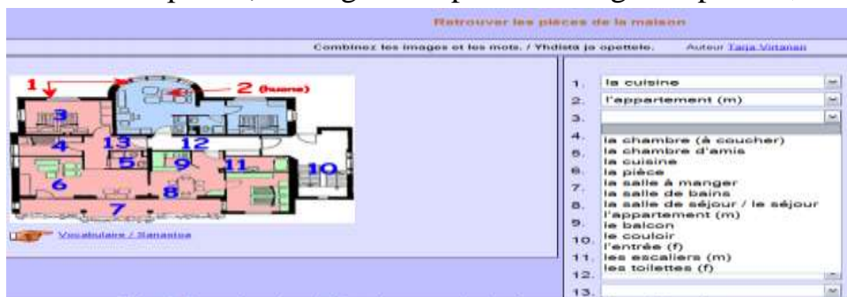
Fig. 9 Exercice de vérification par choix dans une liste déroulante

Ces types d'exercices se prêtent très bien à des vérifications, tant pour la grammaire que pour le lexique. Un autre avantage que présentent les exercices structuraux sur l'ordinateur, à la différence des exercices du même type sur le support papier, est le fait que les élèves doivent agir dans des manières différentes et attrayantes pour donner la réponse : écrire dans une case, choisir dans une liste déroulante la bonne réponse, glisser avec le curseur la bonne réponse, arranger des phrases du genre puzzle, etc.