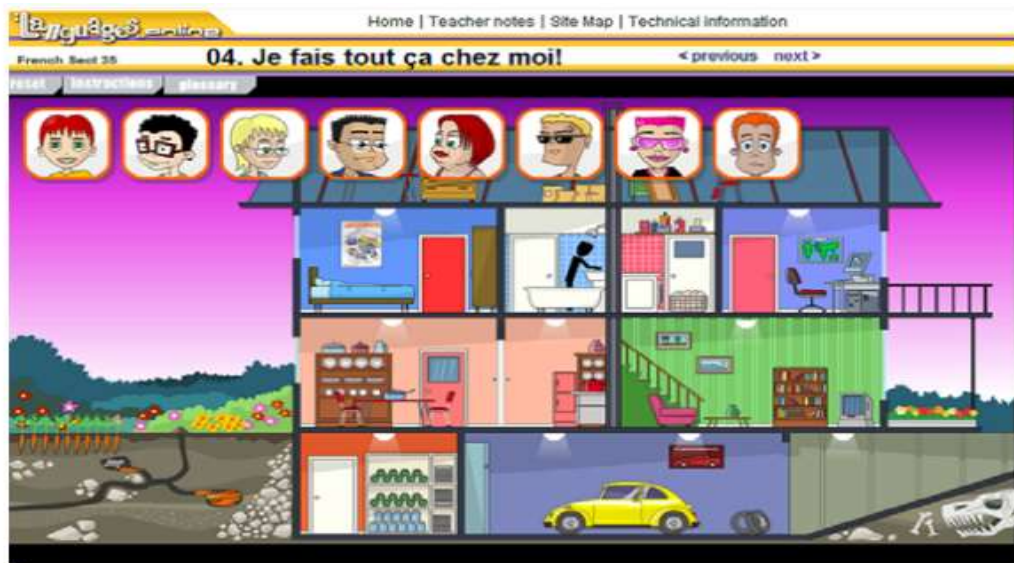
Fig. 5. Exercice de vérification

Du point de vue de la complexité des éléments multimédia, nous présentons l'exercice suivant qui vérifie les connaissances des élèves sur le thème de la maison : il vérifie la compréhension orale et corrige en même temps les réponses. En fonction de la phrase que chaque personnage d'en haut prononce, les élèves doivent remettre le personnage respectif, par glissement, dans la pièce correspondante. Si la réponse est correcte, une animation se déclenche et reproduit l'activité respective. Dans l'image choisie certaines têtes des personnages ont disparu et on peut voir, en revanche, la voiture que le père a mise au garage, ou un autre personnage qui se trouve dans la salle de bain.