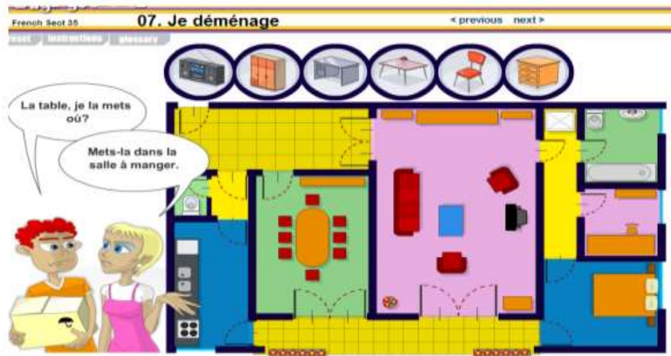
Fig. 4 . Exercice de compréhension orale d'après le dialogue

L'exercice suivant introduit un petit dialogue, ce qui le rend plus proche d'une situation de communication.