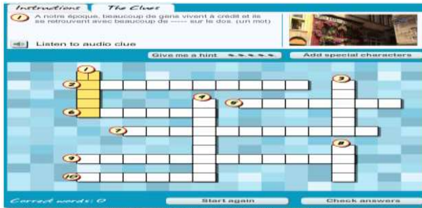
Fig. 8 Vérification par des mots croisés

L'avantage du web dans l'exploitation de ces documents consiste en cela que la modalité d'exploitation est déjà toute faite du point de vue didactique, représentant ainsi un avantage pour les professeurs et permettant aux élèves un déroulement de l'exercice dans un rythme personnel.