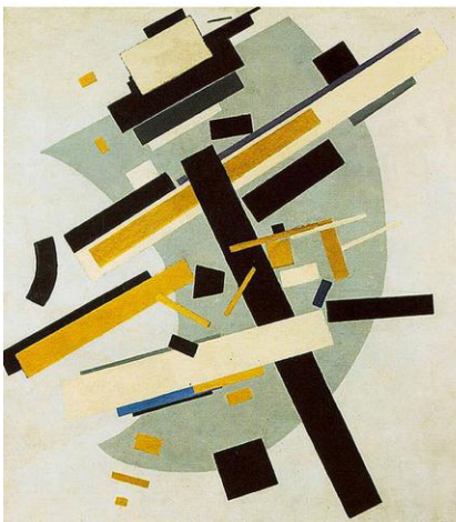
1916, К.Малевич Супрематизм 58 Масло, холст 79.5 x 70.5 см Государственный русский музей Санкт-Петербург