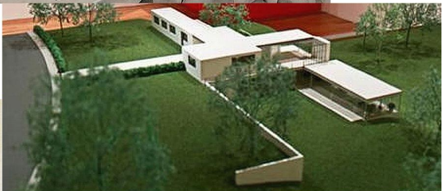
1932, Мис ван дер Роэ дом Герберта Герике макет