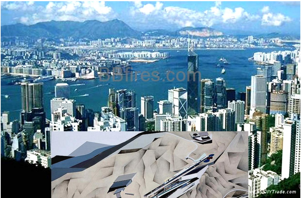
1982 Заха Хадид Пик Гонконга перспективы