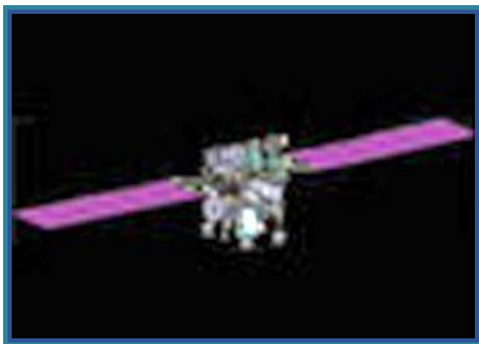
2.3 расм. Монитор-Э сунъий йўлдошининг ташқи кўриниши

Монитор-Э фазовий сунъий йўлдоши 26 август 2005 йилда енгил классдаги «Рокот» ракета-фазовий комплекси ёрдамида Плесецк космодромидан учирилган. Сунъий йўлдош М.В. Хруничев номли Давлат фазовий илмий-ишлаб чиқариш маркази томонидан яратилган. Монитор-Э фазовий сунъий йўлдоши 540 км баландликдаги куёш-синхрон орбитага чиқарилди ва у ҳар 4-6 суткада ер юзасининг бир нуқтаси устидан ўтади. Сунъий йўлдошнинг махсус мосламаси ер юзасининг панхроматик, ҳамда мультиспектрал суратини олишга ва маълумотни ҳақиқий вақтга яқин вақт масштабида узатишга имконият беради. Сунъий йўлдош панхроматик усулда (битта канал) тасвир аниқлиги 8 м билан ва мультиспектрал усулда (учта канал) 20 м билан ер юзасининг рақамли суратларини олишга имконият беради.