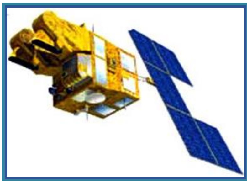
2.4 расм. SPOT 5 сунъий йўлдошининг ташқи кўриниши

SPOT 5 сунъий йўлдоши 3 май 2002 йилда «Ариан-42Р» ракета ташувчиси билан Куру космодромидан 822 км баландликдаги қуёш-синхрон орбитага чиқарилган. Сунъий йўлдош топографик мақсадлар ва рельефнинг моделларини тузиш учун стереожуфтликлар олиш имкониятини берувчи юқори аниқликдаги стереоскопик детектор, ҳамда тасвирларнинг аниқлиги 5 м (SuperMode усулда – 2,5 метргача) бўлган оқ-қора суратлар ва тасвирлашнинг энг кичик ўлчами 10 м бўлган рангли суратлар олиш имкониятини берувчи тасвирлашнинг энг кичик ўлчами юқори бўлган иккита камера билан жиҳозланган. Бундан ташқари SPOT 5 сунъий йўлдошига тасвирлашнинг энг кичик ўлчами 1 км бўлган бутун Ер юзасининг суратларини деярли ҳар куни олиш имкониятини берувчи VEGETATION 2 камераси ўрнатилган. Орбитада жойлашиш муддати 5 йилдан ортиқ.