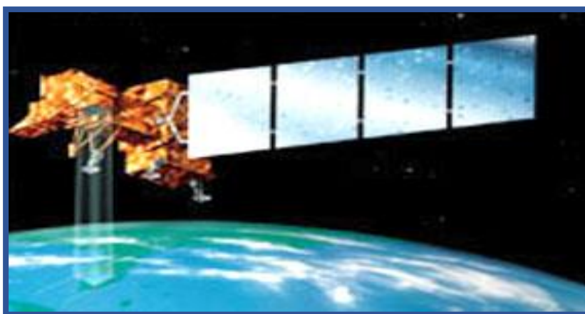
2.1 расм. Landsat-7 сунъий йўлдошининг ташқи кўриниши

Сунъий йўлдош 705 км баландликда қуёш-синхрон орбитага чиқарилган. Landsat-7 сунъий йўлдошига ўрнатилган суратга олиш асбоби Enhanced Thematic Mapper Plus (ETM+) – мукаммаллаштирилган мавзули харитачи кўриш кенлиги ҳамма каналлар учун 185 км, тасвирлашнинг аниқлиги 30 м ли олтита каналда, тасвирлашнинг аниқлиги 60 м ли битта ИҚ каналда ва шу билин бир вақтда ўзида тасвирлашнинг аниқлиги 15 м ли панхроматик ер юзасининг суратини олиш имконини беради. Орбитада жойлашиш муддати тахминан 7 йилни ташкил этади. 5