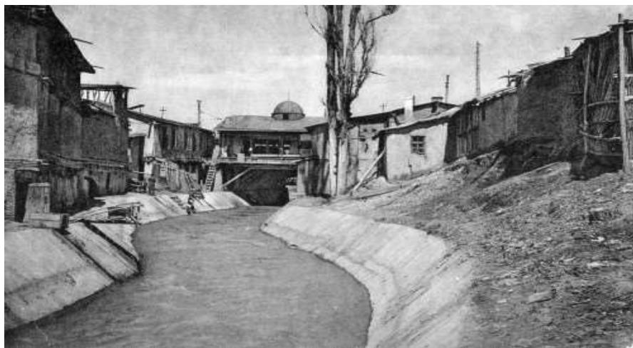
Тошкентнинг Анҳор канали – эски ва янги шаҳар ўртасидаги чегара.

Ундан ташқари, бу даврда деҳқонлардан олинадиган солиқларнинг ҳажми ҳам тобора ортиб борди. Маълумотларга кўра, Туркистонда ер солиғи 1914 йилда 6 859 021 рубл бўлган бўлса, 1916 йилга келиб бу рақам 14 311 771 рублни, яъни, икки баробар кўп миқдори ташкил этган эди. Архив маълумотларига асосланган янги адабиётларда берилишича, 1915 йилда ўлка аҳолисидан махсус ҳарбий солиқ олиниб, бу солиқ пахтакорлар учун ҳар пуд пахтадан 2 рубл 50 коп.ни ташкил этган. Ҳисоб-китобларга кўра, 1915 йилги бу солиқларнинг умумий миқдори 38 329 000 рублдан иборат бўлган.