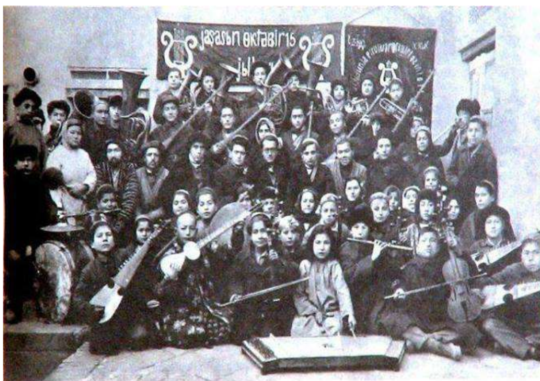
Бухоро мусиқа техникуми ўқитувчи ва талабалари. 30-йилларнинг ўрталари