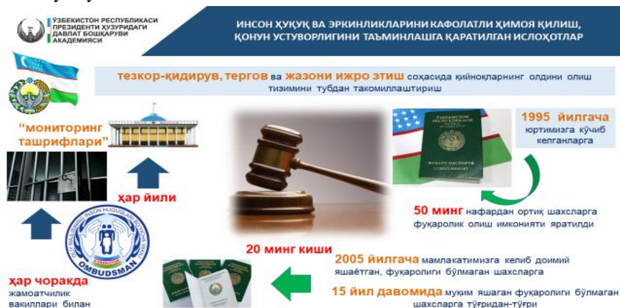
2-rasm. Inson huquq va erkinliklarini kafolatli himoya qilish, qonun ustuvorligini ta'minlashga qaratilgan islohotlar.

Respublikasida yashash guvohnomasi asosida yashab turgan shaxs istak bildirgan taqdirda, O‘zbekiston Respublikasining fuqarosi deb tan olinadi. Shuningdek, ota-onasi (yolg‘iz otasi yoki onasi) O‘zbekiston Respublikasining fuqarolari deb tan olingan bola ham O‘zbekiston Respublikasining fuqarosi deb tan olinishi asoslari ko‘rsatildi. Bu bilan 50 ming nafardan ortiq shaxslarga fuqarolik olish imkoniyati yaratildi.