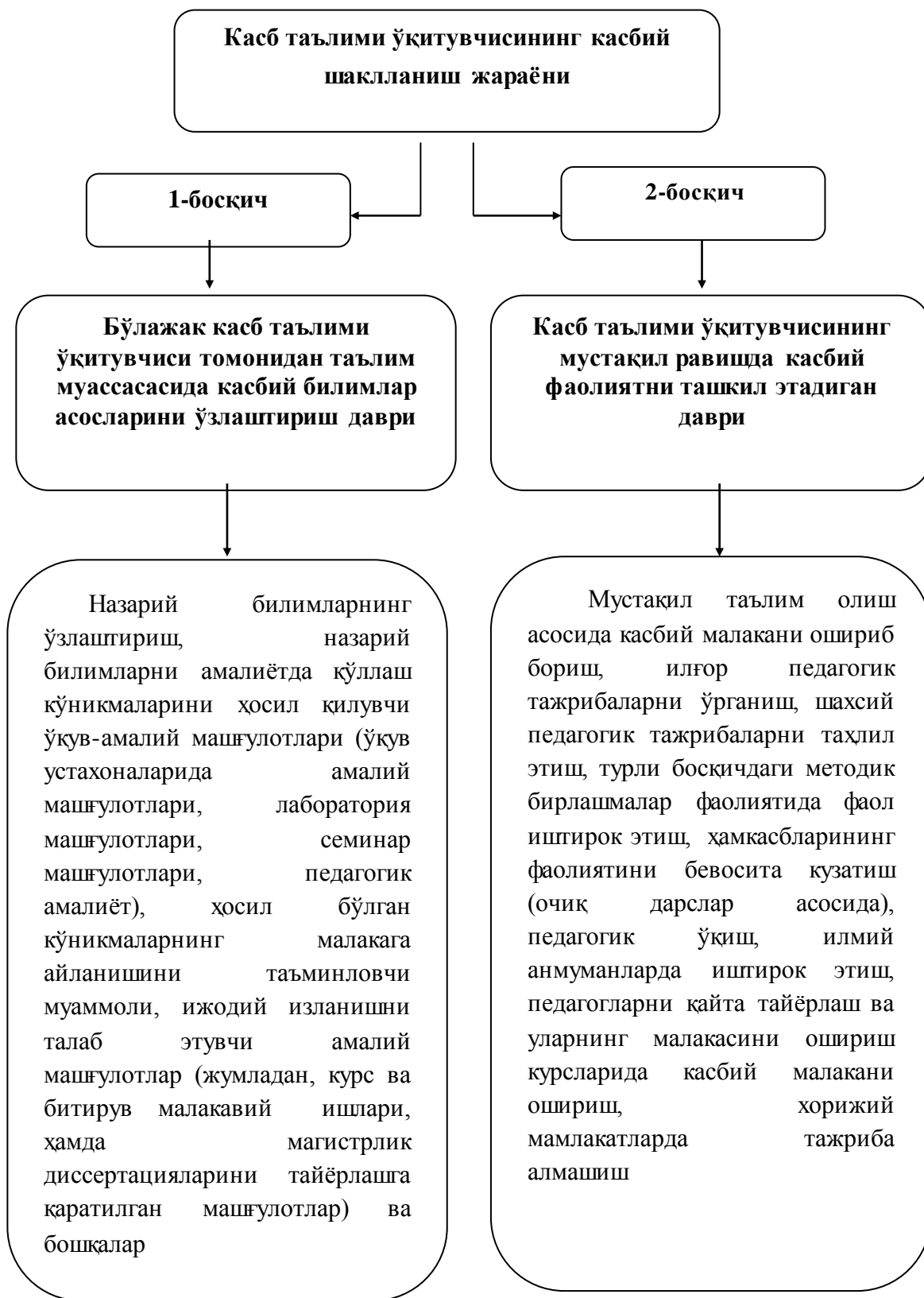
5.2- расм. Касб таълими ўқитувчисининг касбий шаклланиш жараёнининг асосий босқичлари