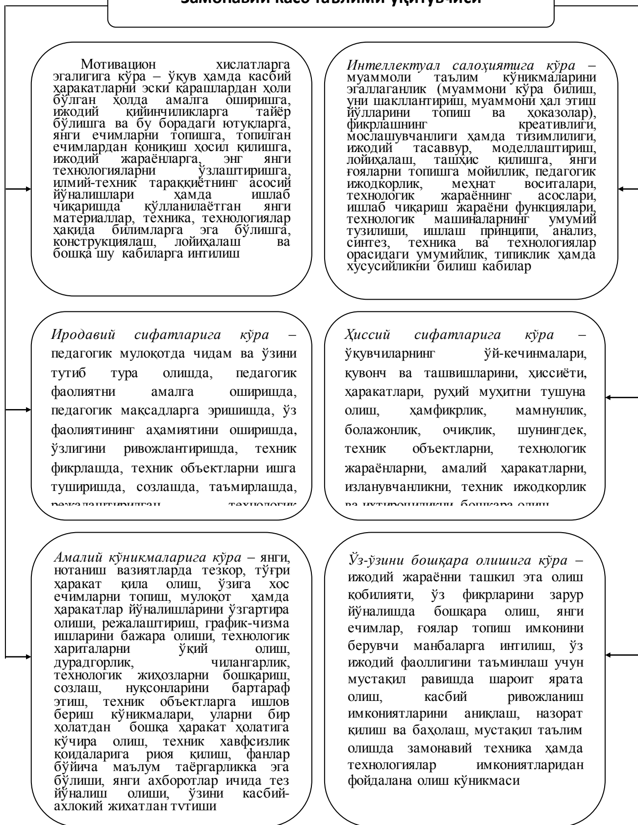
5.1-расм. Касб таълими ўқитувчиларини касбий шакллантириш мезонлари