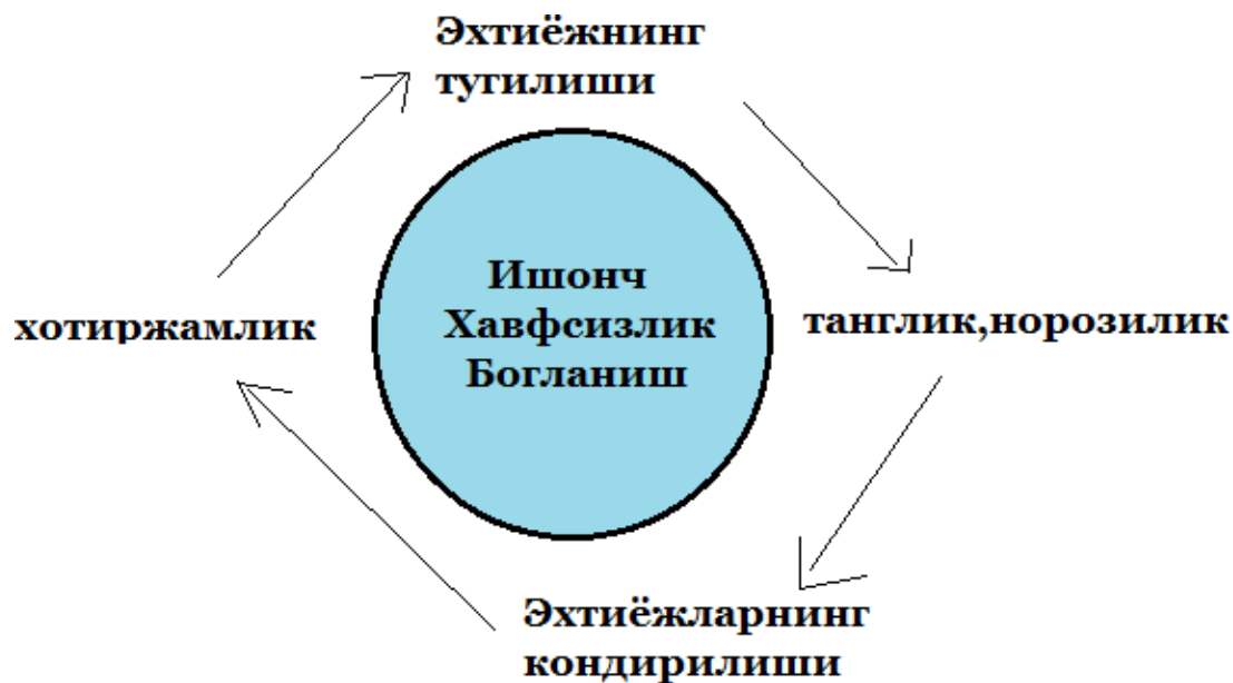
1.2-rasm. Bog‘lanish sikli

Bog‘lanish hissi juda muhim bo‘lgani uchun uning qanday rivojlanishiniko‘rib chiqamiz (1.1.2-rasm).