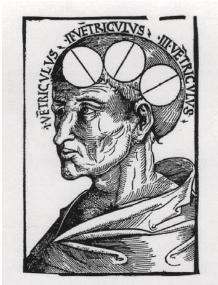
2.2 shakl. Intellect joylashgan qorinchalar (Gerofilus)

Galen (m.a. 3 asr) keyinchalik xilma-xil qobiliyatlar miyaning turli bo'shliqlarida joylashgan degan qarashni rivojlantirdi. Bo'shliqlarda joylashgan pnevma ruhiyat uskunasi sifatida tasvirlangan. Galen Rim gladiatorlariga shifokorlik qilgan va miya jarohatlari qancha chuqur bo'lsa shuncha behushlikka olib kelishini isbotladi.