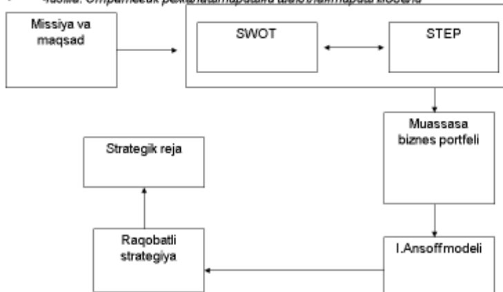
• Чизма. Стратегик режалаштиришни шакллантириш модели